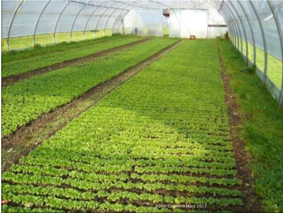
Harro Colshorn März 2017