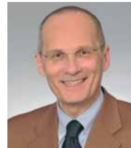
Detlev Bierbaum Oberkirchenrat

G erade wenn es darum geht, die Schöpfung zu bewahren, haben wir als Kirche in der Gesellschaft einen hohen Vertrauensvorschluss. Der Grüne Gockel trägt dazu bei, dass wir diesem Vertrauen gerecht werden.“